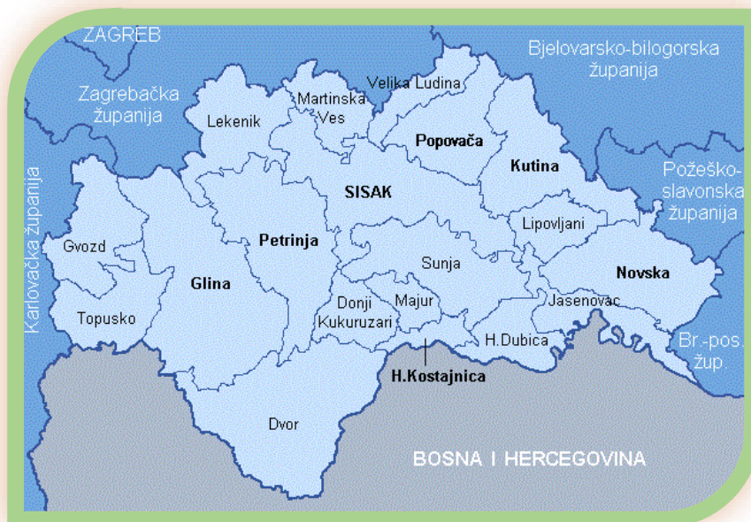
Slika 1. Teritoriji općine Donji Kukuruzari sa graničnim područjima

Općina Donji Kukuruzari mlada je Općina koja pripada dijelu Kontinentalne Hrvatske. Sastavni je dio južnoga dijela Sisačko-moslavačke županije. Djelatnost i osnutak Općine otpočeo je poslijeratne 1993. godine. Općina je teritorijalno, ali i društveno vezana uz susjedne Općine Majur i Sunju, te gradove Hrvatsku Kostajnicu i Petrinju. Teritoriji općine Donji Kukuruzari broje petnaest sastavnih naselja: Babina Rijeka, Borojevići, Donja Velešnja, Gornja Velešnja, Donji Kukuruzari, Gornji Kukuruzari, Donji Bjelovac, Gornji Bjelovac, Komogovina, Kostreši Bjelovački, Lovča, Mečenčani, Knezovljani, Prevršac i Umetići. Sva naselja zajedno čine ukupni teritoriji površine 113,8 km 2 , odnosno 2,5 % teritorija Županije. Središnje naselje općine Donji Kukuruzari je samo istoimeno naselje Donji Kukuruzari za koji je vezana glavnina društvenog i ekonomskog djelovanja Općine. Prema Zakonu o regionalnom razvoju Republike Hrvatske (»Narodne novine«, br. 147/14 i 123/17), Vlada RH donijela je Odluku o razvrstavanju jedinica lokalne i područne (regionalne) samouprave prema stupnju razvijenosti gdje Općina Donji Kukuruzari pripada I. skupini jedinica lokalne samouprave koje se prema vrijednosti indeksa nalaze u zadnjoj četvrtini ispodprosječno rangiranih jedinica lokalne samouprave.